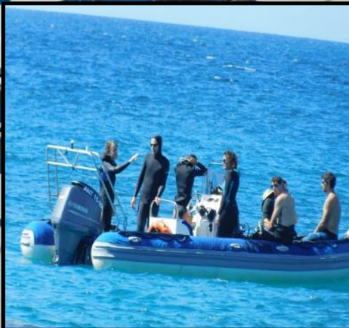
Etat du récif