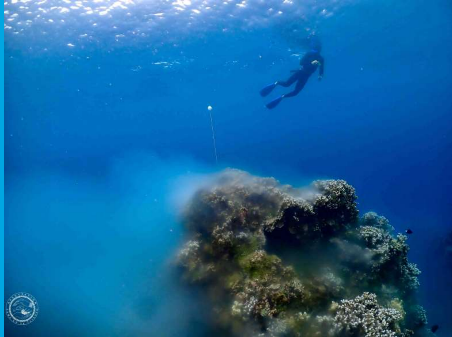
Suivi de la ponte des coraux