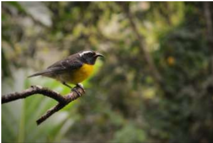
Un sucrier en basse terre, Guadeloupe @RL

Créé en 2009 suite à une enquête sur les besoins des gestionnaires ultramarins