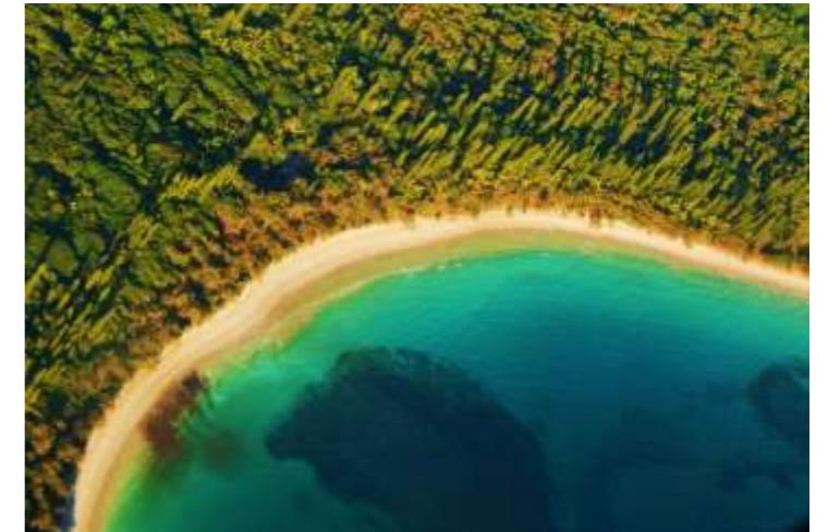
L'île des pins vue d'avion, Nouvelle-Calédonie