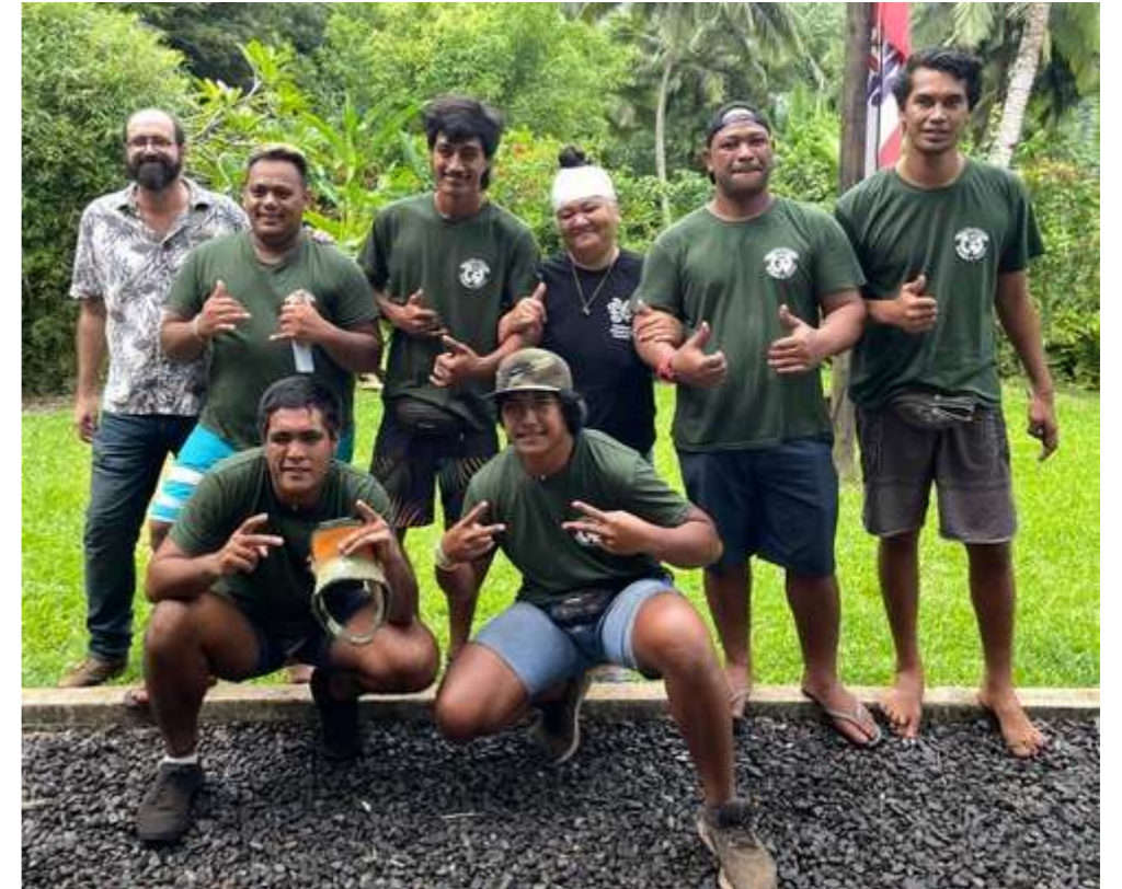
Restauration du littoral