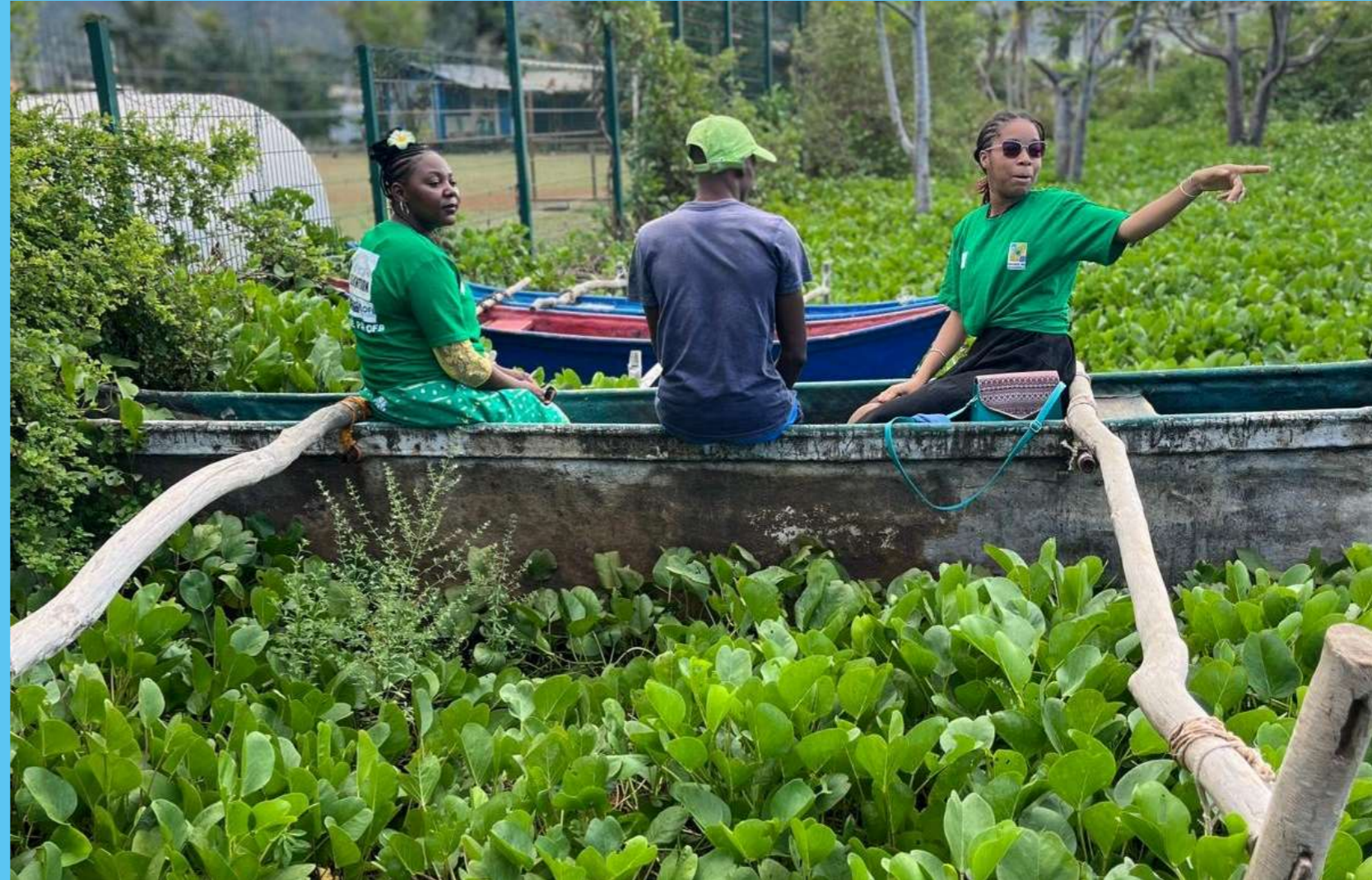
Suivi de la ponte des coraux © Association Tama no te Taioto