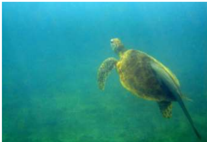
Une tortue verte dans le lagon de Mayotte